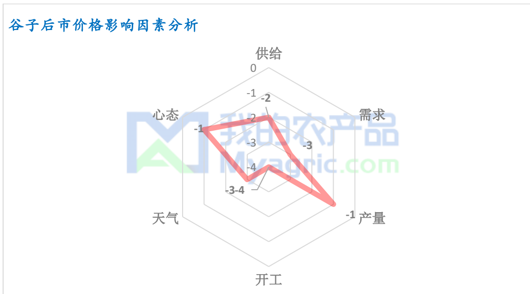
谷子后市价格影响因素分析