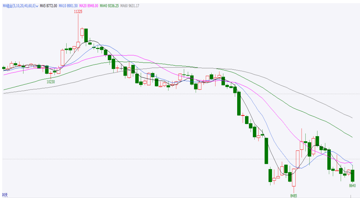
图 3 90 日期货行情走势

截止本周四，红枣期货合约 CJ109 开盘 8835，最高 8910，最低 8640，收盘 8660，涨-145 元/吨，涨幅-1.657%，成交量 87694 手，持仓量 44465 手，日增仓 4658 手。