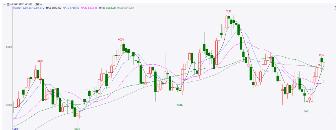
图 2 国内连豆一期货走势图

连豆一主力合约 A2109 持续涨幅：上周五开盘在 5700，最高 5785，最低 5670，本周四收盘 5904，涨 159，涨幅 2.76%。截止本周四，成交量在 147441 手，持仓量在 94538 手。