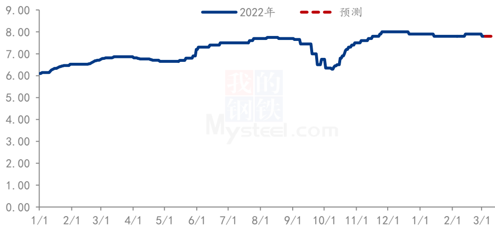
珍珠红小豆价格走势（单位：元/斤）

本周红小豆市场价格下滑，下游市场需求有限，贸易商消化库存，少量商家刚需补充库存，农户持续低价惜售，粮商购销两难，短期内需求暂无好转迹象，不少商家等待需求好转之后出货，预计短期内市场难有提振，延续弱稳趋势运行。