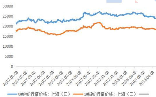
铅锌主流地区期货库存图