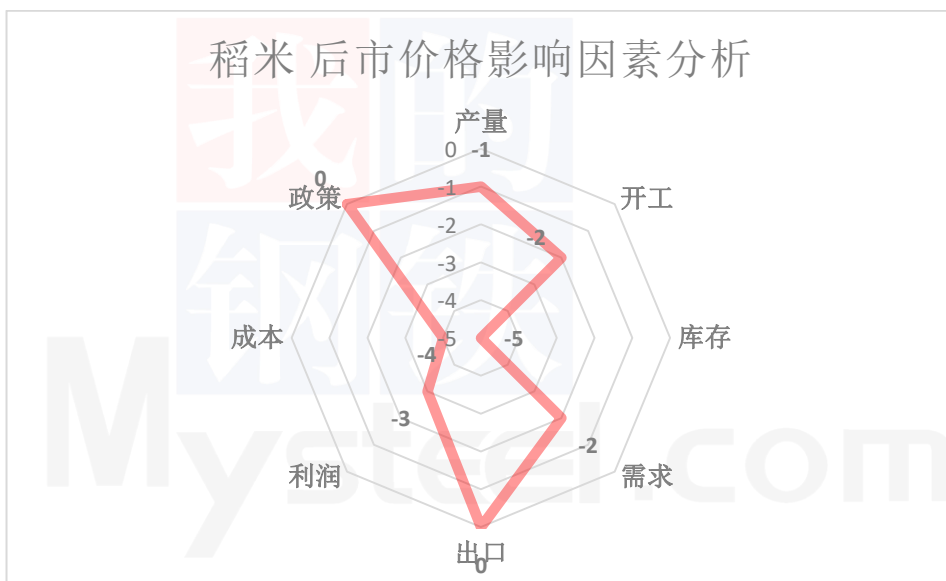
图 3 稻米后市价格影响因素分析