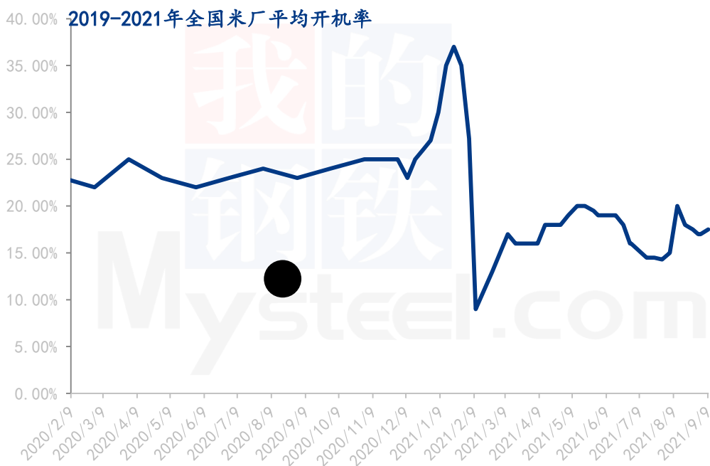
图 1 2019-2021 年全国大米主产区米厂平均开机率

本周全国米厂平均开工率 17.5%左右，与上周基本持平，部分米厂仍加工库存，基本按销定产，预计下周暂无明显提量因素，开机率稳定为主。