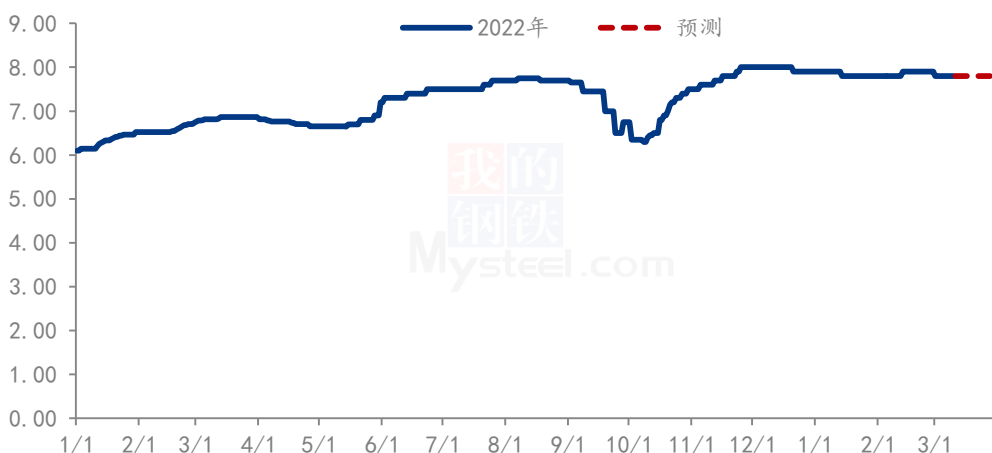
珍珠红小豆价格走势（单位：元/斤）

本周红小豆部分品种存在下滑趋势，市场需求短期内难有提振，产区粮商让利走货，行情持续低迷，虽货源有限支撑价格高位，但市场供需矛盾突出，多数粮商对三四月的需求并不看好，认为存在落价空间。而按照往年国内需求来看，国内产量并不能完全满足市场需求，需求方面仍然存在缺口，关注后期红小豆种植情况。预计后期市场红小豆依旧延续弱稳趋势运行。