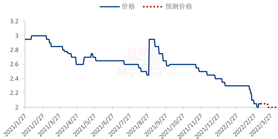
(2021-2022年) 赤峰张杂13号谷子价格走势 (元/斤)

若价格继续下滑，农户出货意向降低，则市场将形成僵持之势。小编认为短期内需多关注贸易主体心态及操作变化，压货行为难成共性，谷子价格将以弱稳为主。长远来看随着后期天气转暖，临近春播，农户出货积极性将有所提升，市场供应量增加，谷价下滑风险随之增加。