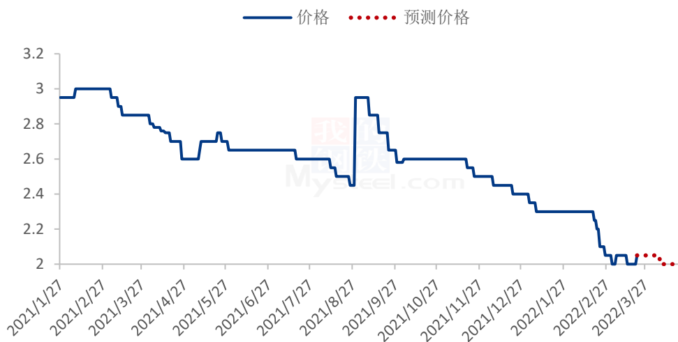
(2021-2022年) 赤峰张杂13号谷子价格走势 (元/斤)