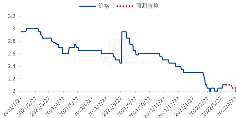
(2021-2022年) 赤峰张杂13号谷子价格走势 (元/斤)

Mysteel 农产品认为短期内谷子价格呈僵持状态，随着交通逐渐恢复，赤峰地区供应优势减弱，物流恢复后市场仍存一定风险。