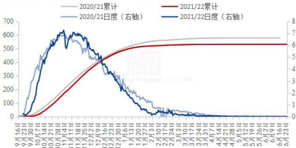
2020-2021 年度新疆地区棉花加工进度统计 (万吨)