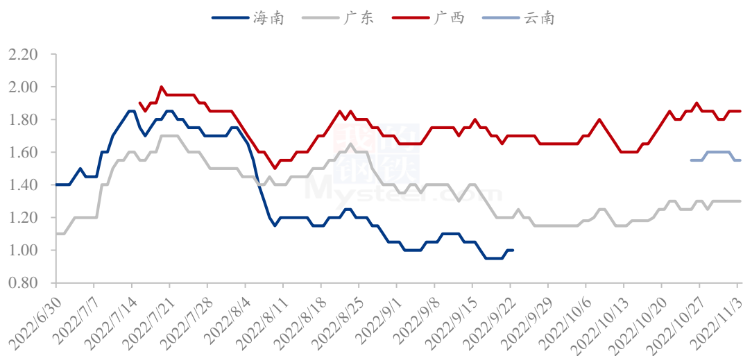
香蕉主产区好货平均价格（元/斤）