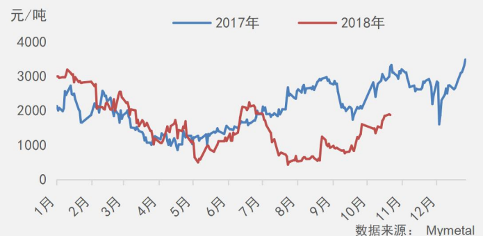
2018年10月12日-10月19日全国主要市场铜库存统计(单位:万吨)