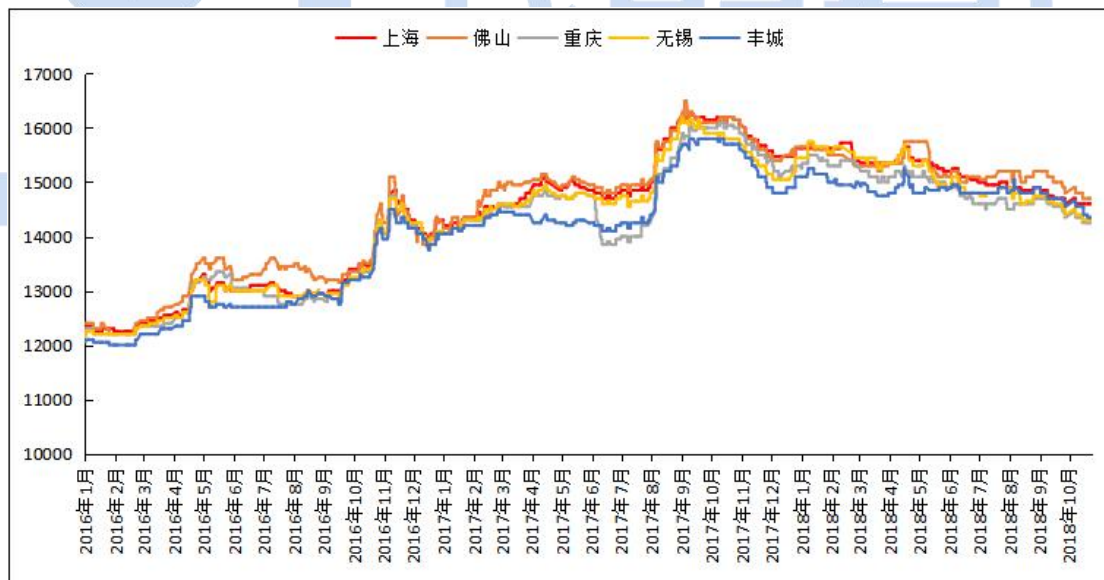
图3 全国主流地区国标 ADC12价格

本周再生铝合金锭市场价格维持平稳。现货方面铝价开始区间震荡，铝合金锭市场成交一般。其中国标 ADC12 华东地区均价 14500 元/吨；华南地区均价 14800 元/吨；西南地区均价 14400 元/吨；华北地区均价 14700 元/吨。本周再生铝市场出货一般，产能偏小的企业目前维持生产订单。产能较大的企业库存开始增多，价格也有往下调的意愿。下游本周拿货一般，正常按需采购。出口方面价格继续下滑，未来价格延续震荡偏弱的势头。