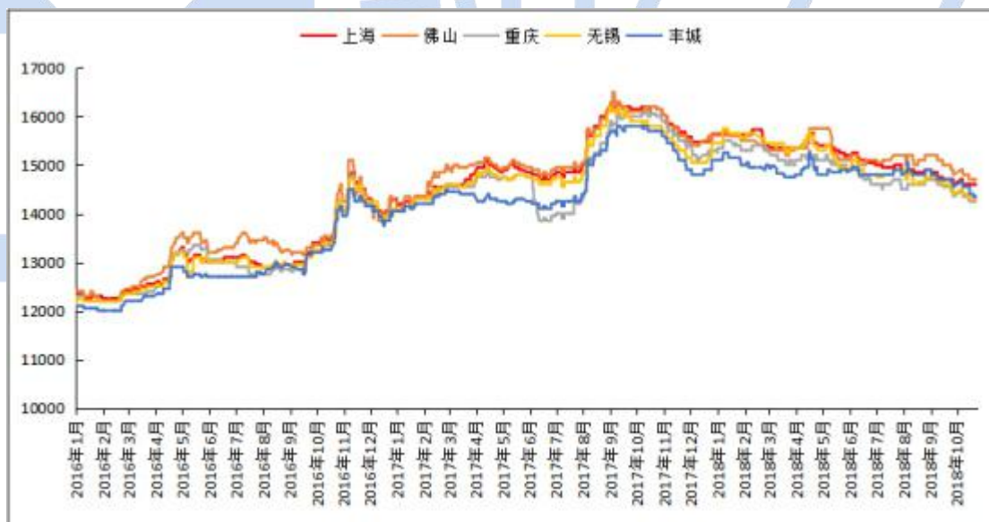
图3 全国主流地区国标 ADC12价格

本周再生铝合金锭市场价格有所下跌。现货方面铝价开始区间震荡，铝合金锭市场成交一般。其中国标 ADC12 华东地区均价 14500 元/吨；华南地区均价 14650 元/吨；西南地区均价 14300 元/吨；华北地区均价 14400 元/吨。本周再生铝市场出货平平，产能偏小的企业目前维持生产订单，产能大的企业再生铝合金企业对市场持悲观态度，下游以销定产，对原料需求不大。ADC12 出口日本 fob 报价 1745 美元/吨，预计未来价格延续震荡偏弱的势头。