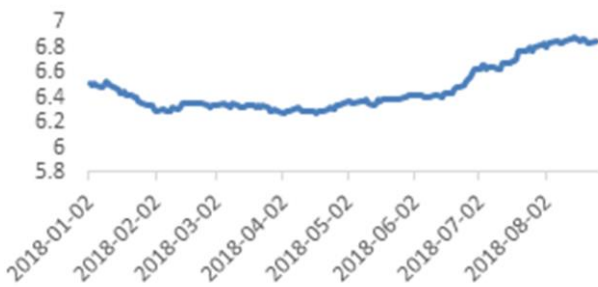
美元兑人民币价格走势