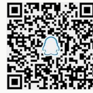
现货交易 QQ 群