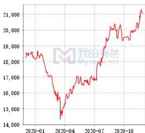
锌 SHFE 与 LME 锌锭库存走势图