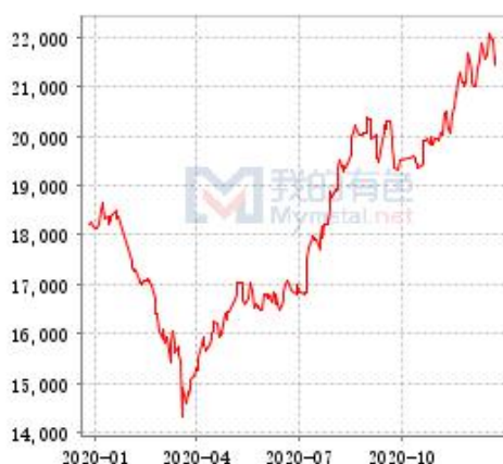
锌 SHFE 与 LME 锌锭库存走势图